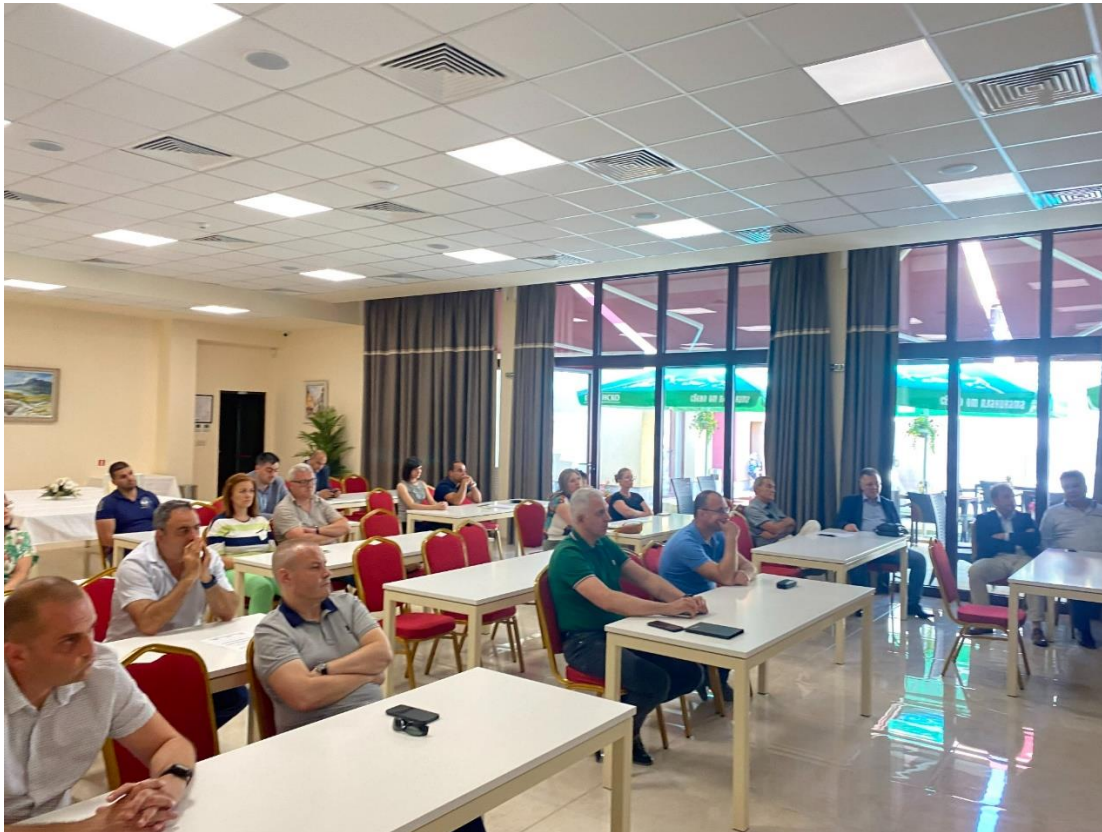
Първа кръгла маса „Декарбонизация“ в град Трявна на 28/06/2022 г.