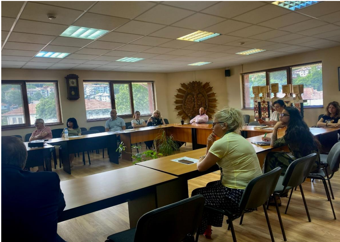
Втора кръгла маса „Децентрализация на енергийния сектор в България“ в град Костинброд на 20/10/2022 г.